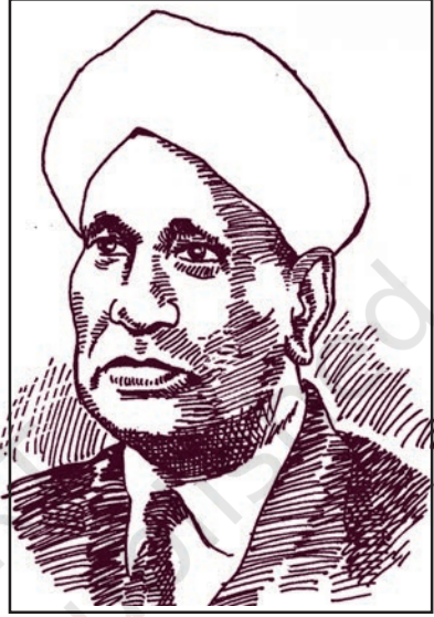
सर चंद्रशेखर वेंकट रामन्

रामन् का मस्तिष्क विज्ञान के रहस्यों को सुलझाने के लिए बचपन से ही बेचैन रहता था। अपने कॉलेज के जमाने से ही उन्होंने शोधकार्यों में दिलचस्पी लेना शुरू कर दिया था। उनका पहला शोधपत्र फिलॉसॉफिकल मैगजीन में प्रकाशित हुआ था। उनकी दिली इच्छा तो यही थी कि वे अपना सारा जीवन शोधकार्यों को ही समर्पित कर दें, मगर उन दिनों शोधकार्य को पूरे समय के कैरियर के रूप में अपनाने की कोई खास व्यवस्था नहीं थी। प्रतिभावान छात्र सरकारी नौकरी की ओर आकर्षित होते थे। रामन् भी अपने समय के अन्य सुयोग्य छात्रों की भाँति भारत सरकार के वित्त-विभाग में अफ़सर बन गए। उनकी तैनाती कलकत्ता* में हुई।