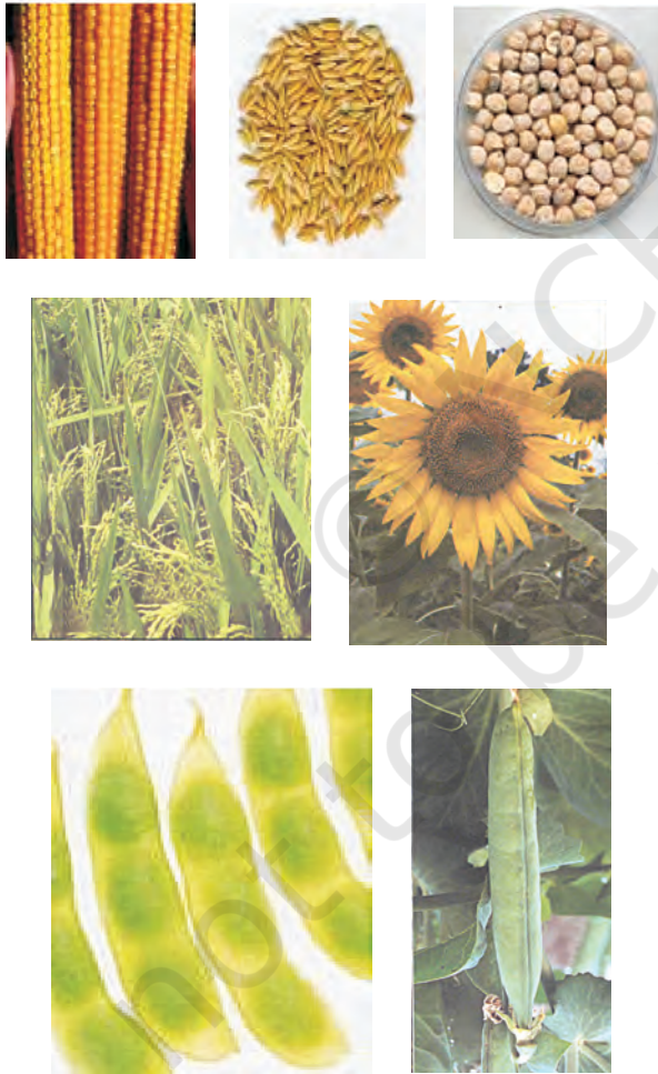
चित्र 15.1: विभिन्न प्रकार की फसलें

ऊर्जा की आवश्यकता के लिए अनाज; जैसे-गेहूँ, चावल, मक्का, बाजरा तथा ज्वार से कार्बोहाइड्रेट प्राप्त होता है। दालें जैसे चना, मटर, उड़द, मूँग, अरहर, मसूर से प्रोटीन प्राप्त होती है और तेल वाले बीजों; जैसे-सोयाबीन, मूँगफली, तिल, अरंड, सरसों, अलसी तथा सूरजमुखी से हमें आवश्यक वसा प्राप्त होती है (चित्र 15.1)। सब्जियाँ, मसाले तथा फलों से हमें विटामिन तथा खनिज लवण, कुछ मात्रा में प्रोटीन, वसा तथा कार्बोहाइड्रेट भी प्राप्त होते हैं। चारा फसलें; जैसे-वर्सीम, जई अथवा सूडान घास का उत्पादन पशुधन के चारे के रूप में किया जाता है।