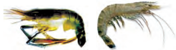
मेक्रोब्रेकियम रोजेन वर्गी (ताज़ा पानी)

भविष्य में समुद्री मछलियों का भंडार (stock) कम होने की अवस्था में इन मछलियों की पूर्ति संवर्धन के द्वारा हो सकती है। इस प्रणाली को समुद्री संवर्धन (मेरीकल्चर) कहते हैं।