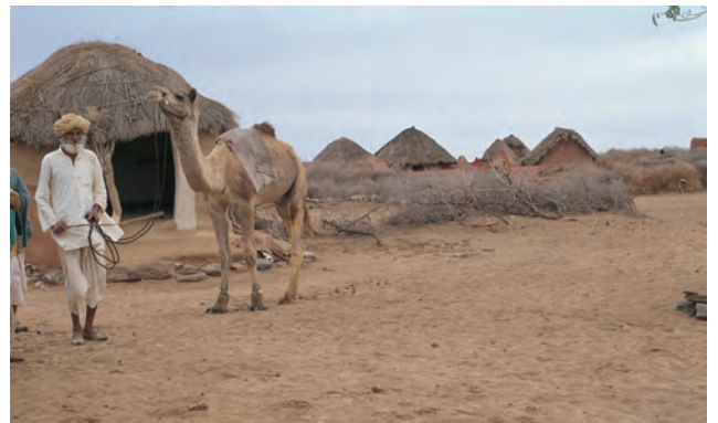
चित्र 6 - अपने ऊँट के साथ एक ऊँटपालक.

यह राजस्थान में जैसलमेर के निकट थार का रेगिस्तान है। इस इलाके के ऊँट पालकों को मारू (रेगिस्तान) राइका और उनकी बस्ती को ढंडी कहा जाता है।