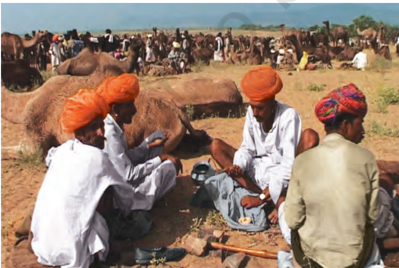
चित्र 8 - पुष्कर का ऊँट मेला.

आइए, अब देखें कि औपनिवेशिक शासन के दौरान यानी अंग्रेजों के ज़माने में चरवाहों का जीवन किस तरह बदला?