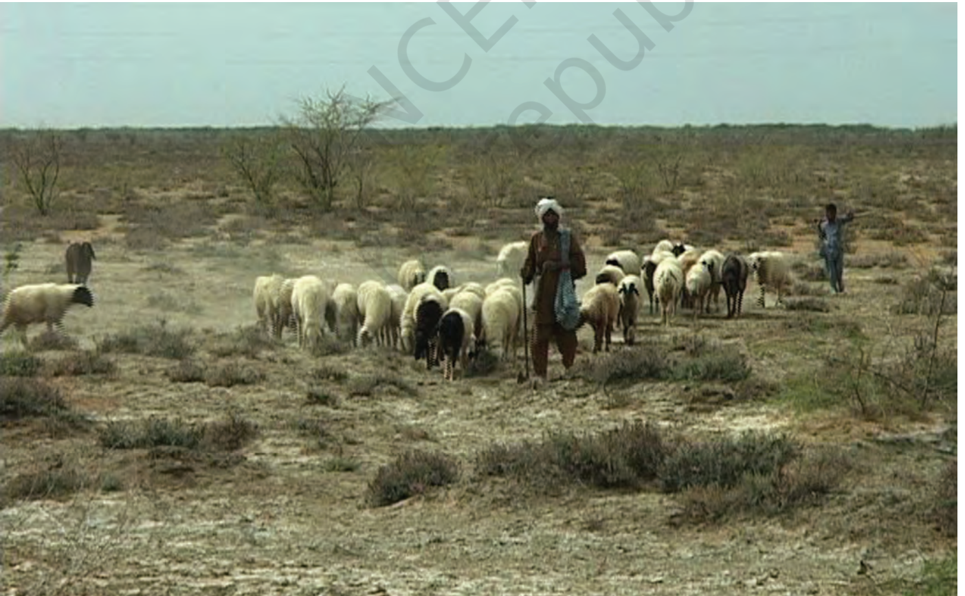
चित्र 10 - चरागाहों की तलाश में निकले मालधारी चरवाहे। उनके गाँव कच्छ की रन में स्थित हैं।

वंशावली बताने वाला समुदाय का इतिहास बताता है। इस तरह की मौखिक परंपराओं से चरवाहा समुदायों को अपनी पहचान का भाव मिलता है। इन परंपराओं से हम यह पता लगा सकते हैं कि कोई समूह अपने अतीत को किस तरह देखता है।