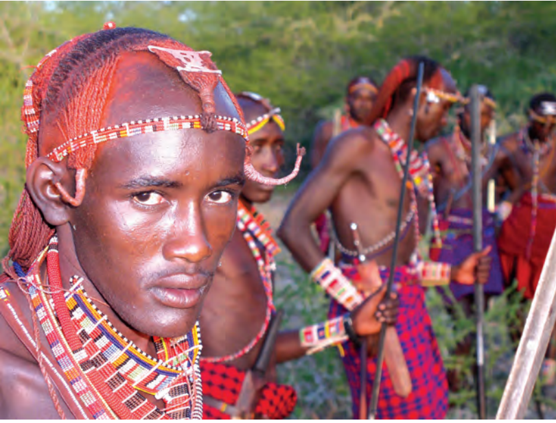
चित्र 17 - आज भी योद्धा बनने के लिए युवकों को व्यापक अनुष्ठानों से गुजरना पड़ता है हालाँकि अब यह प्रथा पहले जैसी प्रचलित नहीं है। इसके लिए युवकों को लगभग चार माह तक अपने कबीले के इलाके का दौरा करना पड़ता है। इस यात्रा के अंत में वे छापामारों की तरह दौड़कर अपने अहाते में घुसते हैं। इस समारोह के मौके पर युवक ढीले कपड़े पहनते हैं और पूरे दिन नाचते रहते हैं। इस अनुष्ठान के साथ ही वे जीवन के एक नए चरण में पहुँच जाते हैं। लड़कियों को इस तरह के अनुष्ठानों से नहीं गुजरना पड़ता।

युद्ध में बहादुरी का प्रदर्शन करके अपनी मर्दानगी साबित कर देते थे। फिर भी वे वरिष्ठ जनों के नीचे रह कर ही काम करते थे।