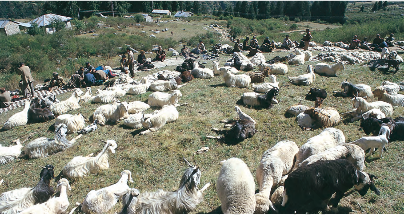
चित्र 3 - ऊन उतारने का इंतज़ार। हिमाचल प्रदेश स्थित पालमपुर के पास उहल घाटी।

और स्पीति के गाँवों में एक बार फिर कुछ समय के लिए रुकते। इस बीच वे गर्मियों की फ़सलें काटते और सर्दियों की फ़सलों की बुवाई करके आगे बढ़ जाते। यहाँ से वे अपने रेवड़ लेकर शिवालिक की पहाड़ियों में जाड़ों वाले चरागाहों में चले जाते और अगली अप्रैल में भेड़-बकरियाँ लेकर वे दोबारा गर्मियों के चरागाहों की तरफ़ रवाना हो जाते।