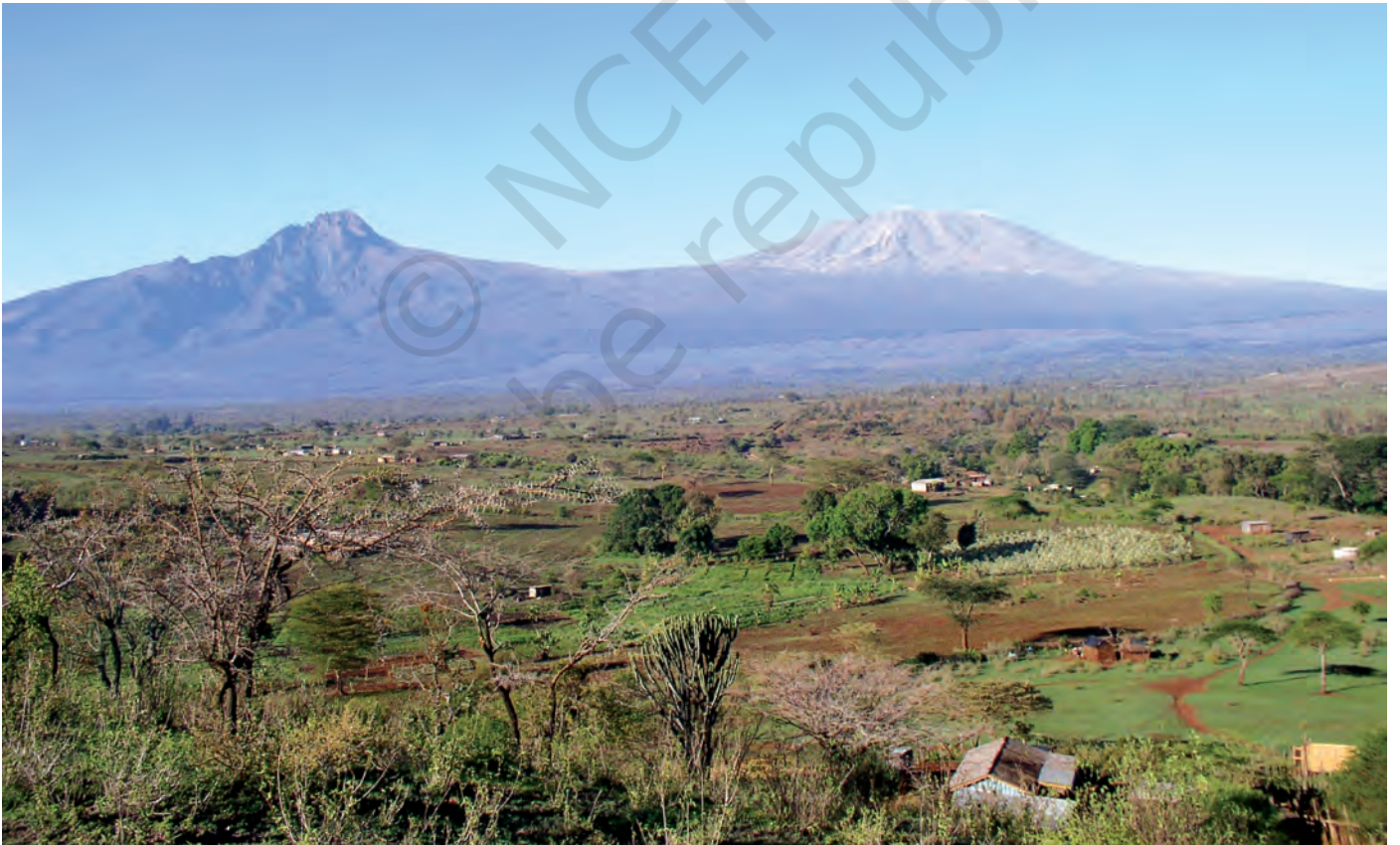
चित्र 12 - मासाई लैंड जिसके पीछे किलिमंजारो पहाड़ दिखाई दे रहे हैं।

हिंदुस्तान की तरह अफ्रीकी चरवाहों की ज़िंदगी में भी औपनिवेशिक और उत्तर-औपनिवेशिक काल में गहरे बदलाव आए हैं। आखिर क्या थे ये बदलाव?