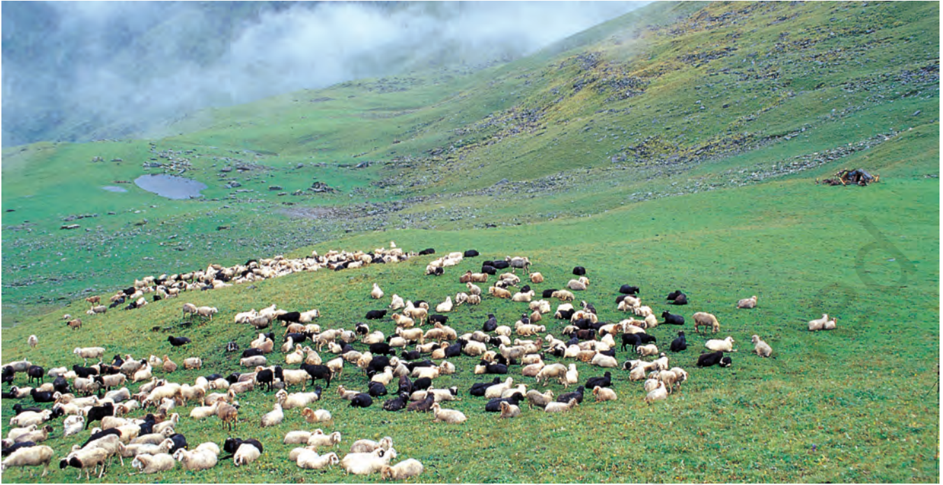
चित्र 1 - पूर्वी गढ़वाल के बुग्याल में चरती भेड़ें।

बुग्याल ऊँचे पहाड़ों पर 12,000 फुट से भी ज्यादा ऊँचाई पर स्थित विशाल प्राकृतिक चरागाह होते हैं। जाड़ों में ये बर्फ से ढके रहते हैं और अप्रैल के बाद हरे-भरे हो जाते हैं। इस समय पहाड़ियों की तलहटी तरह-तरह की घास, जड़ों और जड़ी-बूटियों से भरी रहती है। मॉनसून तक इन चरागाहों में घनी हरियाली छा जाती है और चारों तरफ फूल ही फूल दिखाई देने लगते हैं।