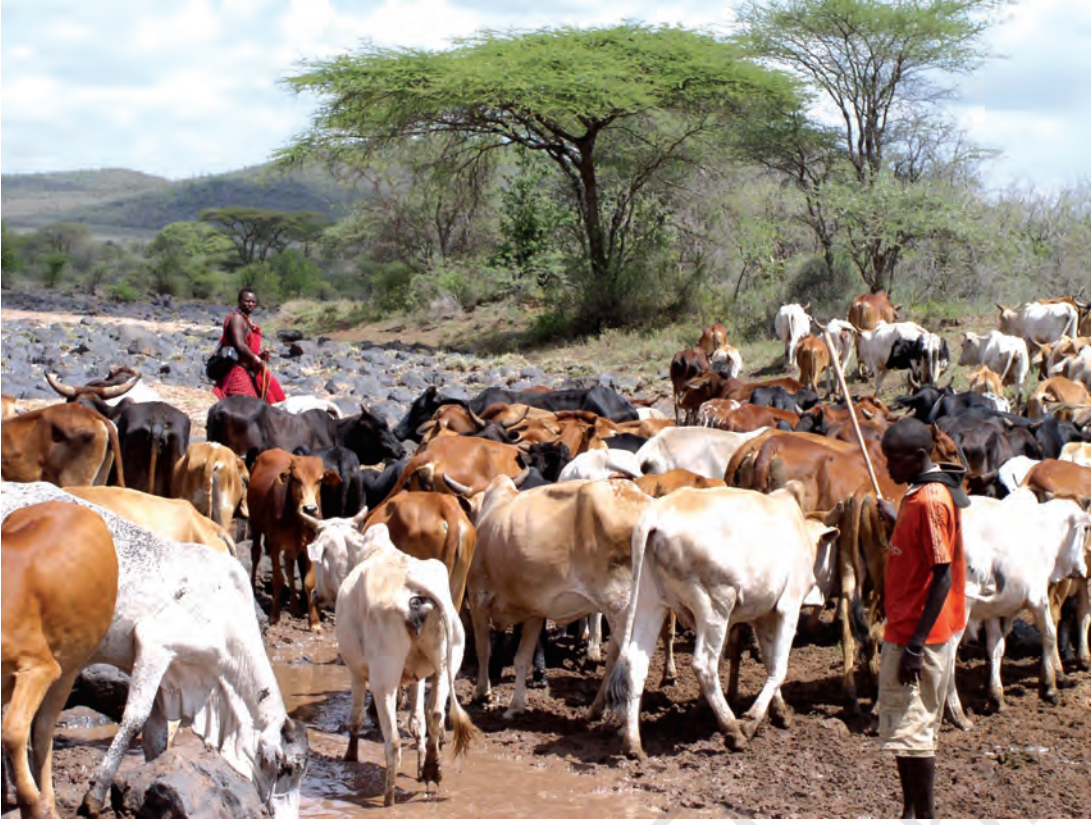
चित्र 15 - मासाई नाम 'मा' शब्द से निकला है। मा-साई का मतलब होता है 'मेरे लोग'। परंपरागत रूप से मासाई घुमंतू और चरवाहा समुदाय के लोग होते हैं जो अपनी आजीविका के लिए दूध और मांस पर आश्रित रहते हैं। ऊँचे तापमान और कम वर्षा के कारण यहाँ शुष्क, धूल भरे और बेहद गर्म हालात रहते हैं। इस अर्ध-शुष्क विषुववृत्तीय इलाके में सूखे के हालात सामान्य हैं। ऐसे समय में बहुत सारे जानवर मर जाते हैं।