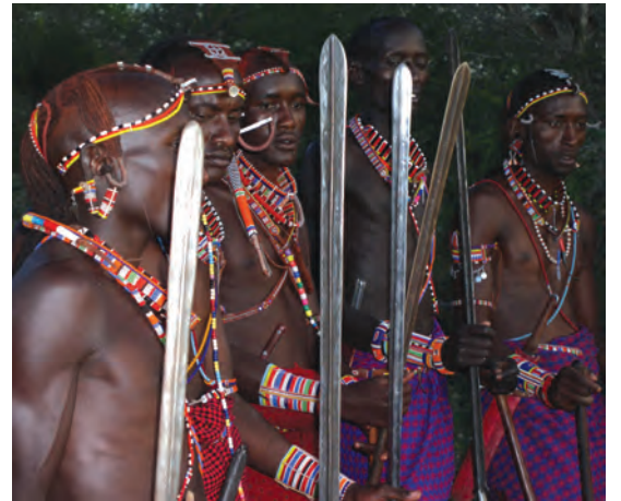
चित्र 16 - योद्धा गहरे लाल रंग की शुका और चमकदार मोतियों के आभूषण पहनते हैं तथा स्टील की नोक वाला पाँच फुट लंबा भाला रखते हैं। बारीकी से सँवारे गए उनके बाल गेरू से रंगे होते हैं। उगते सूरज को सम्मान देने के लिए वे पूर्व की ओर मुँह करके खड़े होते हैं। योद्धा अपने समुदाय की रक्षा करते हैं और लड़के पशुओं को चराते हैं। सूखे के मौसम में योद्धा और लड़के, दोनों ही पशु चराते हैं।

औपनिवेशिक काल में अफ्रीका के बाकी स्थानों की तरह मासाइलैंड में भी आए बदलावों से सारे चरवाहों पर एक जैसा असर नहीं पड़ा। उपनिवेश बनने से पहले मासाई समाज दो सामाजिक श्रेणियों में बँटा हुआ था – वरिष्ठ जन (एल्डर्स) और योद्धा (वॉरियर्स)। वरिष्ठ जन शासन चलाते थे। समुदाय से जुड़े मामलों पर विचार-विमर्श करने और अहम फैसले लेने के लिए वे समय-समय पर सभा करते थे। योद्धाओं में ज़्यादातर नौजवान होते थे जिन्हें मुख्य रूप से लड़ाई लड़ने और कबीले की हिफ़ाज़त करने के लिए तैयार किया जाता था। वे समुदाय की रक्षा करते थे और दूसरे कबीलों के मवेशी छीन कर लाते थे। जहाँ जानवर ही संपत्ति हो वहाँ हमला करके दूसरों के जानवर छीन लेना एक महत्वपूर्ण काम होता था। अलग-अलग चरवाहा समुदायों की ताकत इन्हीं हमलों से तय होती थी। युवाओं को योद्धा वर्ग का हिस्सा तभी माना जाता था जब वे दूसरे समूह के मवेशियों को छीन कर और