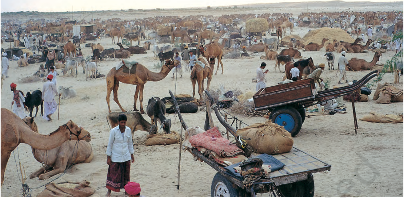
चित्र 7 - पश्चिमी राजस्थान में बलोतरा स्थित ऊँट मेला.

ऊँटपालक यहाँ ऊँटों की खरीद-फरोख्त के लिए आते हैं। मेले में मारू राइका ऊँटों के प्रशिक्षण में अपनी महारत का भी प्रदर्शन करते हैं। इस मेले में गुजरात से घोड़े भी लाए जाते हैं।