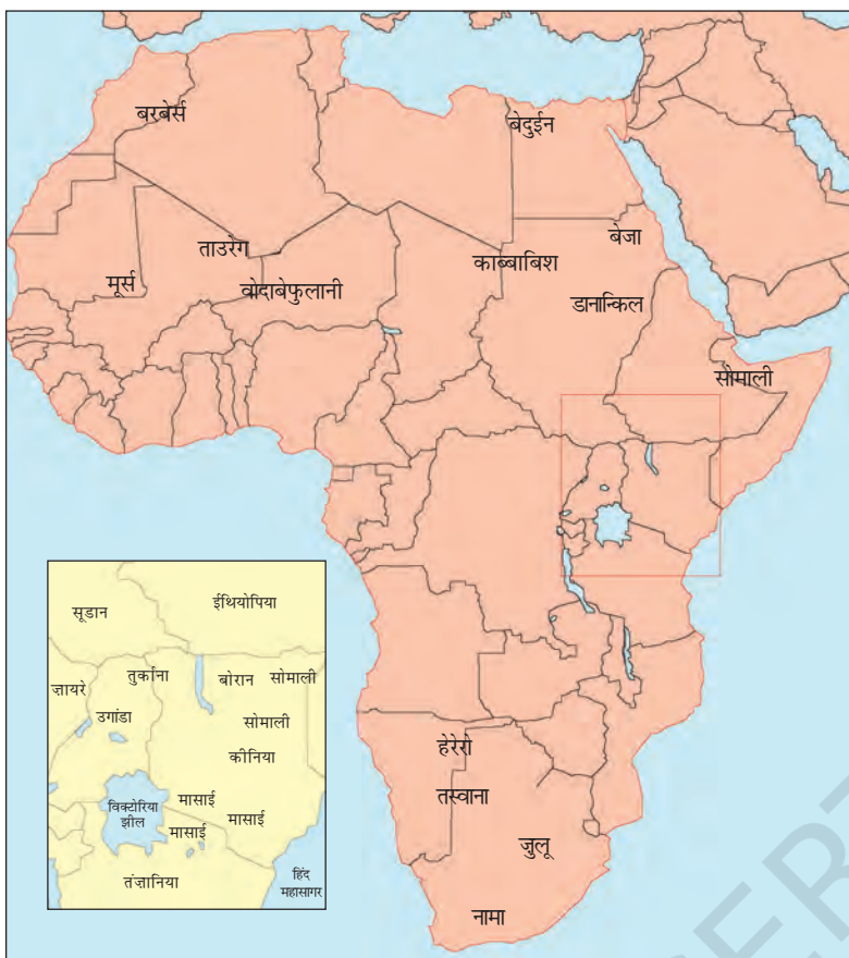
चित्र 13 - अफ्रीका के चरवाहा समुदाय.

छोटी तस्वीर (इनसेट) में कीनिया और तंज़ानिया में मासाइयों का इलाका दर्शाया गया है।