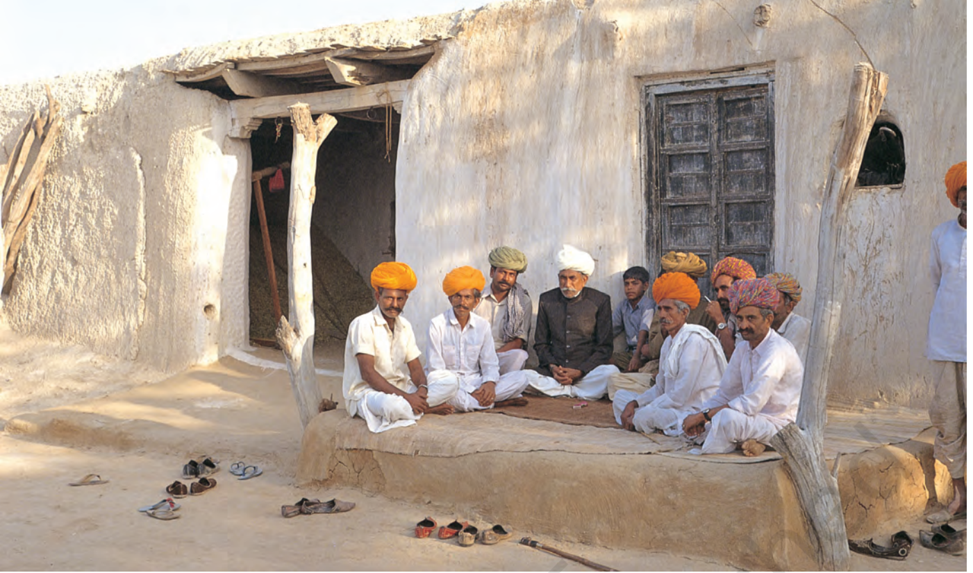
चित्र 9 - मारू राइकाओं की वंशावली बताने वाला.

वंशावली बताने वाला समुदाय का इतिहास बताता है। इस तरह की मौखिक परंपराओं से चरवाहा समुदायों को अपनी पहचान का भाव मिलता है। इन परंपराओं से हम यह पता लगा सकते हैं कि कोई समूह अपने अतीत को किस तरह देखता है।