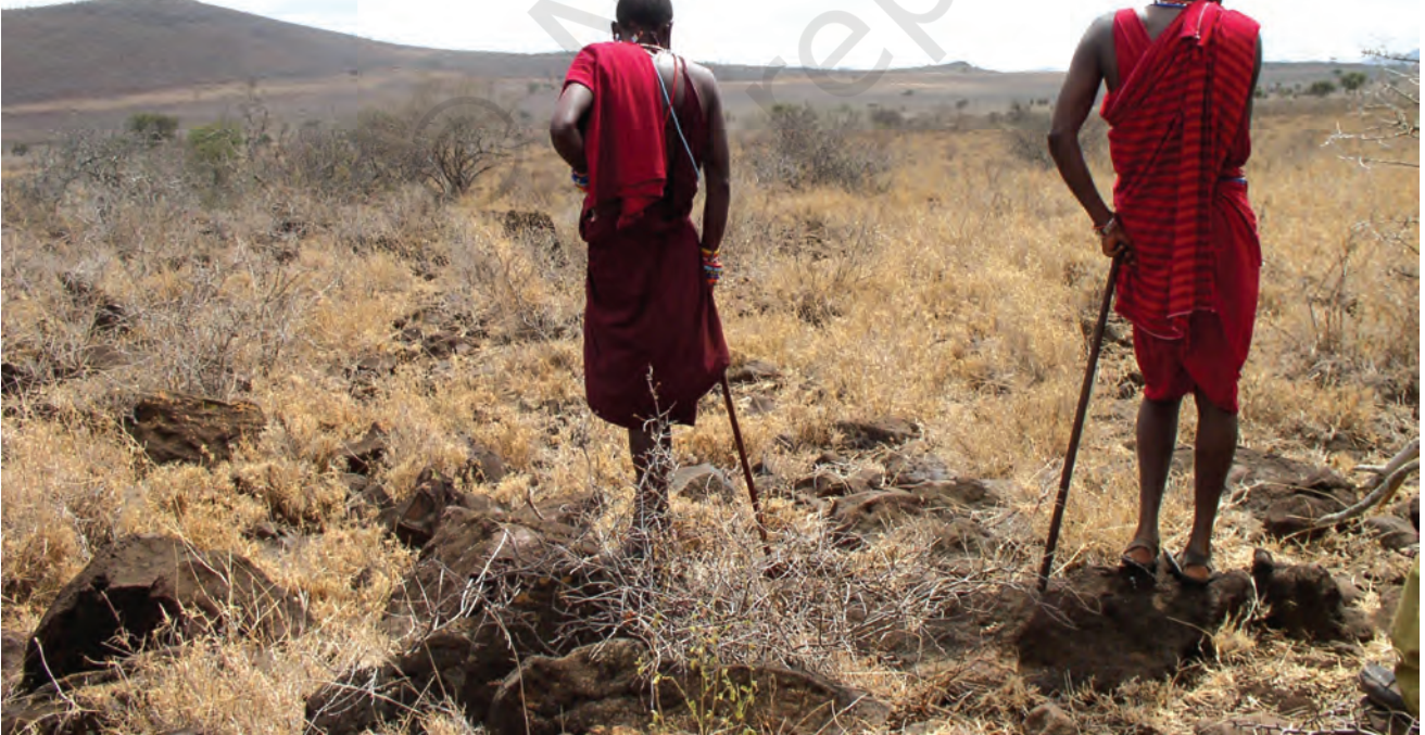
चित्र 14 - घास के बिना पशु (मवेशी, बकरियाँ और भेड़ें) कुपोषण का शिकार हो जाते हैं जिसका मतलब है कि चरवाहों के परिवारों और बच्चों के लिए भोजन कम पड़ने लगता है। सूखे और भोजन की सर्वाधिक कमी से ग्रस्त इलाका अम्बोसेली नैशनल पार्क के आसपास पड़ता है जिसकी पर्यटन से होने वाली आय पिछले साल लगभग 24 करोड़ कीनियन शिलिंग (लगभग 35 लाख अमेरिकी डॉलर) थी। किलिमंजारो जल परियोजना भी इसी इलाके से होकर जाती है लेकिन यहाँ रहने वाले समुदाय न तो पीने के लिए और न ही सिंचाई के लिए इस परियोजना के पानी का इस्तेमाल कर सकते हैं।

बहुत सारे चरागाहों को शिकारगाह बना दिया गया। कीनिया में मासाई मारा व साम्बूरू नैशनल पार्क और तंज़ानिया में सेरेन्गेटी पार्क जैसे शिकारगाह इसी तरह अस्तित्व में आए थे। इन आरक्षित जंगलों में चरवाहों का आना मना था। इन इलाकों में न तो वे शिकार कर सकते थे और न अपने जानवरों को चरा सकते थे। ऐसे बहुत सारे आरक्षित जंगलों में अब तक मासाई अपने ढोर-डंगर चराया करते थे। मिसाल के तौर पर सेरेन्गेटी नैशनल पार्क का 14,760 वर्ग किलोमीटर से भी ज़्यादा क्षेत्रफल मासाइयों के चरागाहों पर कब्ज़ा करके बनाया गया था।