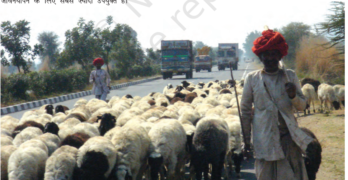
चित्र 18 - जयपुर राजमार्ग पर राइका गड़रिये.

चरवाहे अतीत के अवशेष नहीं हैं। वे ऐसे लोग नहीं हैं जिनके लिए आज की आधुनिक दुनिया में कोई जगह नहीं है। पर्यावरणवादी और अर्थशास्त्री अब इस बात को काफ़ी गंभीरता से मानने लगे हैं कि घुमंतू चरवाहों की जीवनशैली दुनिया के बहुत सारे पहाड़ी और सूखे इलाकों में जीवनयापन के लिए सबसे ज़्यादा उपयुक्त है।