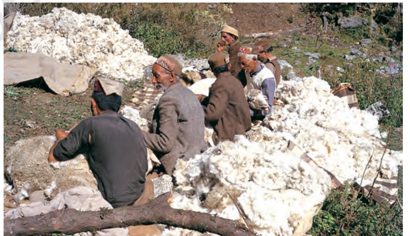
चित्र 4 - गद्दी भेड़ों की ऊन उतार रहे हैं।

भाबर : गढ़वाल और कुमाऊँ के इलाके में पहाड़ियों के निचले हिस्से के आसपास पाए जाने वाला शुष्क या सूखे जंगल का इलाका। बुग्याल : ऊँचे पहाड़ों में स्थित घास के मैदान।