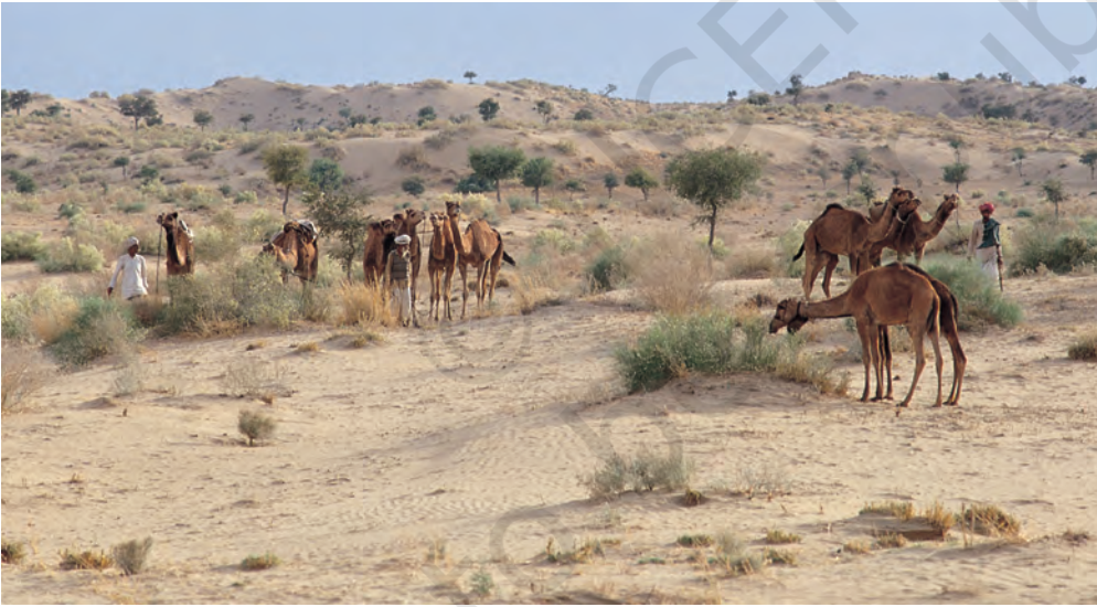
चित्र 5 - पश्चिमी राजस्थान के थार रेगिस्तान में चरते राइका समुदाय के ऊँट.

धंगर महाराष्ट्र का एक जाना-माना चरवाहा समुदाय है। बीसवीं सदी की शुरुआत में इस समुदाय की आबादी लगभग 4,67,000 थी। उनमें से ज्यादातर गड़रिये या चरवाहे थे हालाँकि कुछ लोग कम्बल और चादरें भी बनाते थे जबकि कुछ भैंस पालते थे। धंगर गड़रिये बरसात के दिनों में महाराष्ट्र के मध्य पठारों में रहते थे। यह एक अर्ध-शुष्क इलाका था जहाँ बारिश बहुत कम होती थी और मिट्टी भी खास उपजाऊ नहीं थी। चारों तरफ सिर्फ कंटैली झाड़ियाँ होती थीं। बाजरे जैसी सूखी फ़सलों के अलावा यहाँ और कुछ नहीं उगता था। मॉनसून में यह पट्टी धंगरों के जानवरों के लिए एक विशाल चरागाह बन जाती थी। अक्टूबर के आसपास धंगर बाजरे की कटाई करते थे और चरागाहों की तलाश में पश्चिम की तरफ चल पड़ते थे। करीब महीने भर पैदल चलने के बाद वे अपने रेवड़ों के साथ कोंकण के इलाके में जाकर डेरा डाल देते थे। अच्छी बारिश और उपजाऊ मिट्टी की बदौलत इस इलाके में खेती खूब होती थी। कोंकणी किसान भी इन चरवाहों का दिल खोलकर स्वागत करते थे। जिस समय धंगर कोंकण पहुँचते थे उसी समय कोंकण के किसानों को खरीफ़ की फ़सल काट कर अपने खेतों को रबी की फ़सल के लिए दोबारा उपजाऊ बनाना होता था।